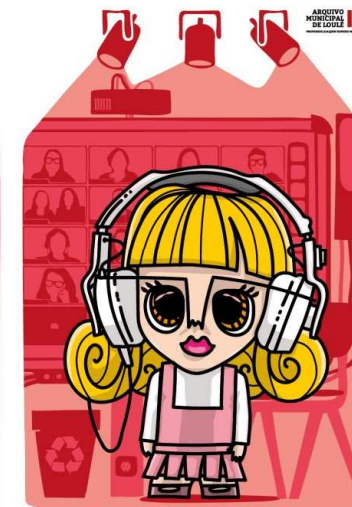
Família dos Professores FILHA