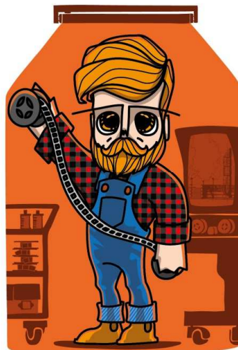
Família dos Investigadores PAI