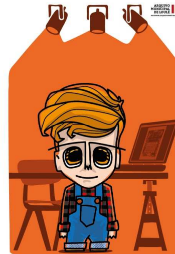
Família dos Investigadores FILHO