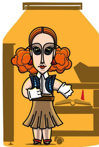
Família dos Arquivistas MÃE