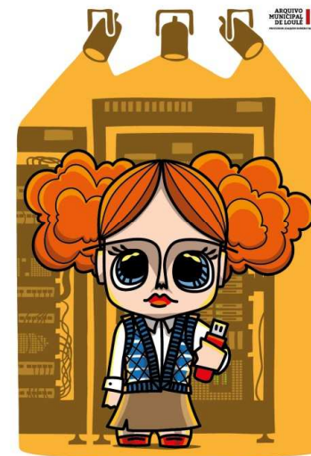
Família dos Arquivistas FILHA