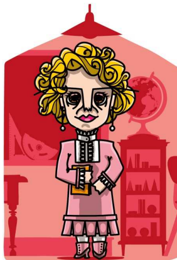
Família dos Professores AVÓ