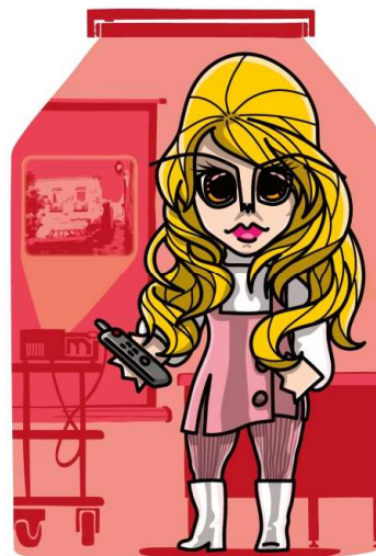
Família dos Professores MÃE