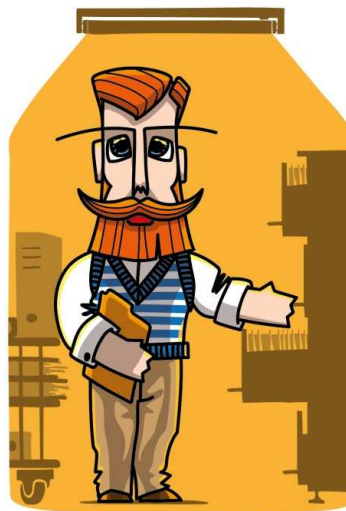
Família dos Arquivistas PAI