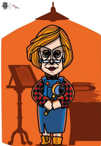
Família dos Investigadores AVÓ