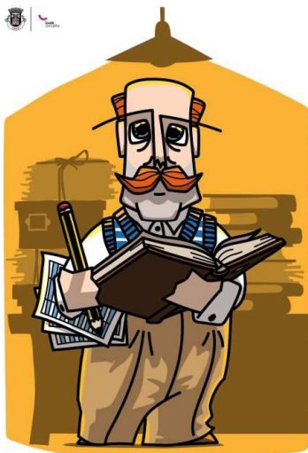
Família dos Arquivistas AVÔ