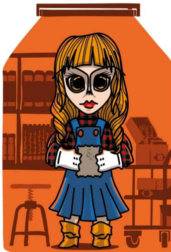
Família dos Investigadores MÃE