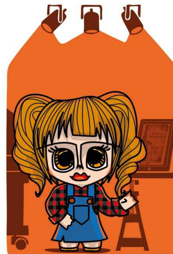
Família dos Investigadores FILHA