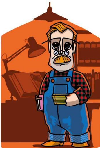
Família dos Investigadores AVÔ