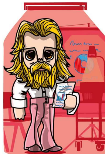
Família dos Professores PAI