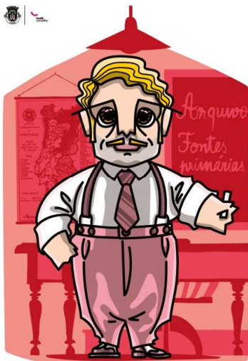
Família dos Professores AVÔ